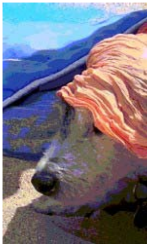
Une vraie vie de chien