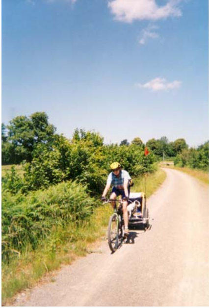
Repos du chien