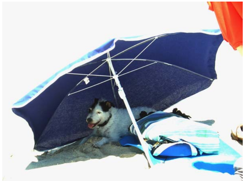
Encore mieux a l'arrivé